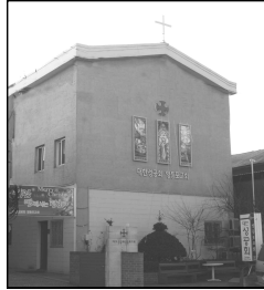
성 공 회